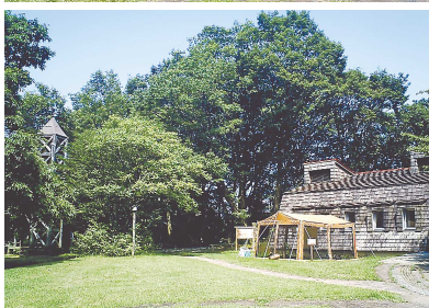
野外のテントで若鳥のトレーニングが始まる