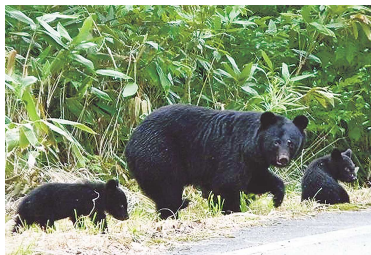
ツキノワグマの親子