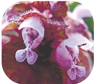
ヒメオドリコソウの花。 踊り子に見えるかな