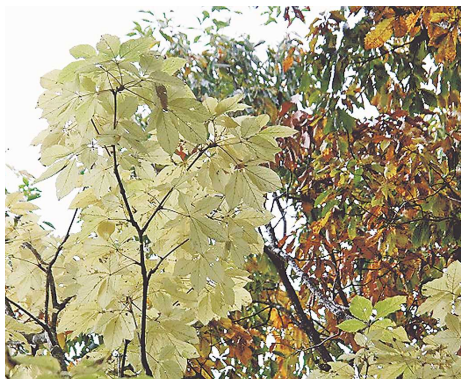
コシアブラの紅葉

ねいの里でも「ガマズミ」は赤、「クロモジ」は黄、「コシアブラ」は白になります。植物たちが冬を迎える準備をしているのです。水生庭園の近くにある「カツラ」の落葉からは香ばしい香りがします。空気が澄んでいるからでしょうか。また 木だけではありません。草も「エノコログサ」の穂は太陽を浴びて金色に輝き、「イヌタデ」は葉まで赤くなっています。秋晴れの日に紅葉狩りをしてみませんか。（野澤和子）