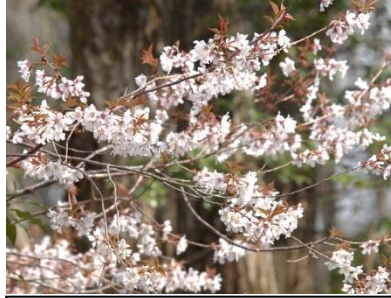
キンキマメザクラ