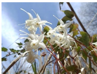
トキワイカリソウ