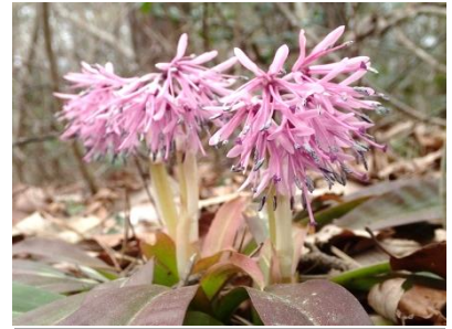
ショウジョウバカマ

マンサクは〈春にまず咲く〉の言葉通り、ねいの里で一番早く咲く花です。(ねいの里にあるのは、積雪地に適応したマルバマンサクという種類。)その後を追うようにキンキマメザクラ、ショウジョウバカマ、カタクリと続きます。春の女神と言われるギフチョウが現れ、カタクリやショウジョウバカマで吸蜜しながら飛び交う可愛い姿を見せてくれるのも、この頃です。