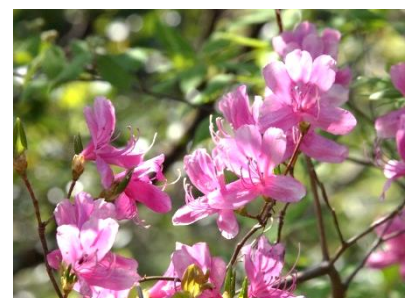
ユキグニミツバツツジ