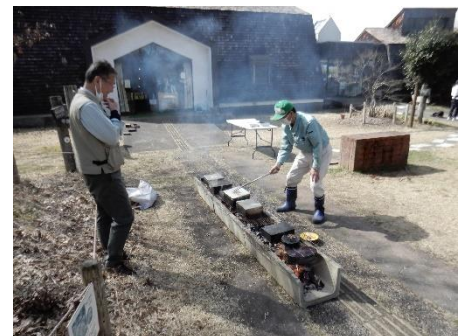
化粧炭を焼いています。