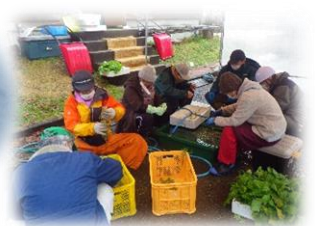
採取、洗浄作業が大変！！