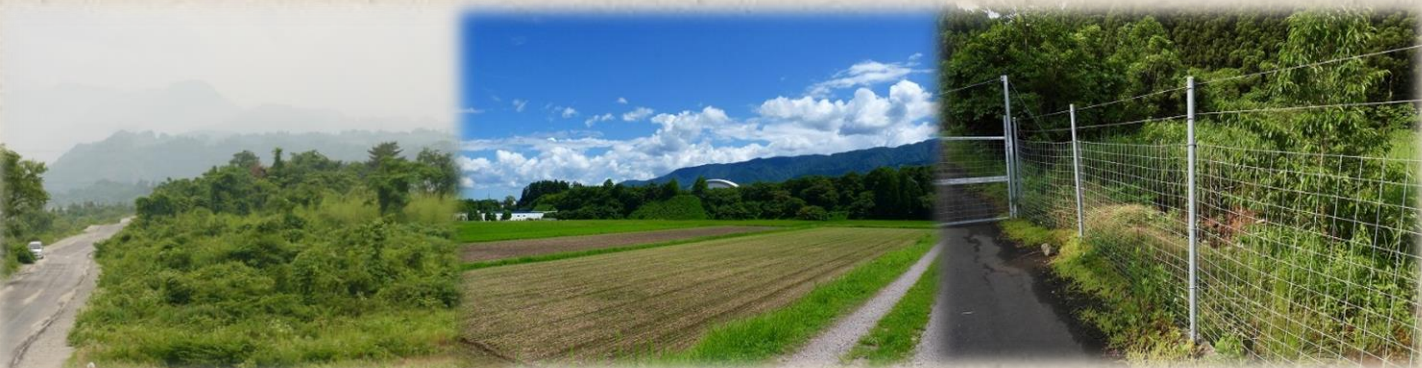
河川敷のヤブや河畔林などを移動

堅果類の凶作年は、通常クマが出発しない地域に出没することがあります。山際地域の集落はもちろん、河川敷のヤブや河畔林や河岸段丘の林などを移動し、より低標高地域へ出没することがあり、近隣での新しいクマの目撃・痕跡情報の把握に努めてください。なお、この地域でも見通しいい環境づくりを行う。また、電気柵や恒久柵の設置により、移動経路の分断（山際も含めて）を検討しましょう。近隣でクマの情報があつた場合は、不要不急の外出は控え、屋内や車の中などへ避難してください。