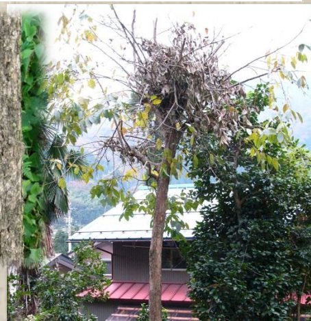
カキの木に残るクマ棚