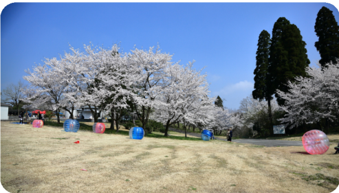
※写真は過去の様子です

雨天の場合は、旧いこの村館内で実施します。 その際、実施内容が変更になる場合がありますのでご了承ください。