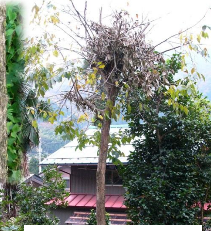
カキの木に残るクマ棚