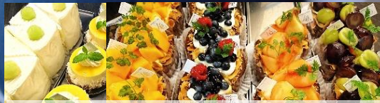
~7.8日は、 秋フェスタ天空カフェ限定の秋スイーツを~

ル・クール太閤山ランドオリジナルケーキ & 六角堂ドリンクセット ケーキ100個 限定! ※各日 ¥1,000 (税込)